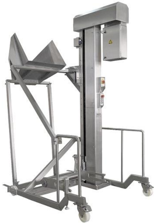
31.0317.20 – su ratukais ir pakrovimo loveliais