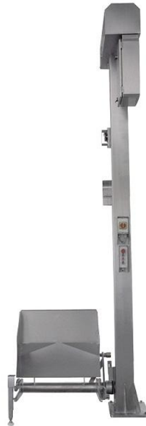
31.0324.00 – su dėklu