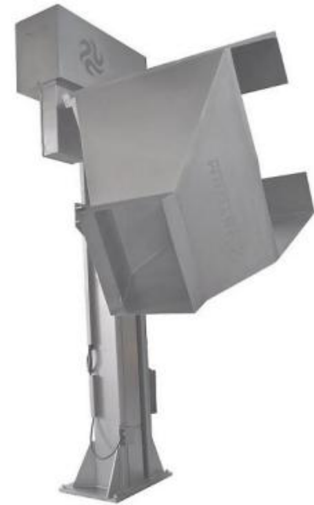
31.0620.25 – padėklams su loveliais