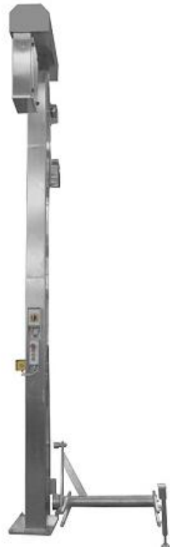
31.1330.47 – iškrovimo kampas 47°, papildomas mygtukas judėjimui žemyn