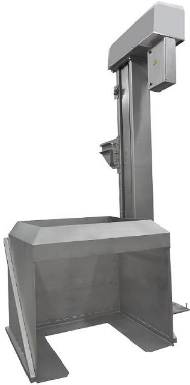
31.0625.26 – padėklams, 500 kg