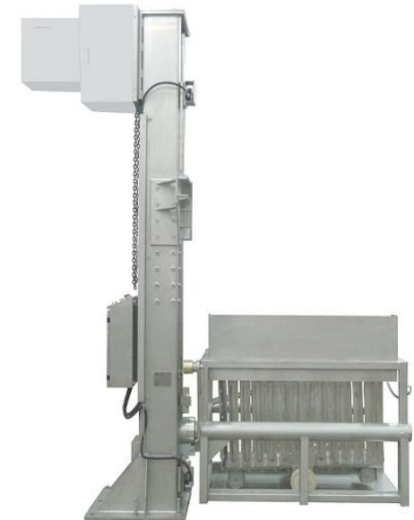
31.0420.51 – specialūs vežimėliai, pavara montuojama ant galinės kolonos