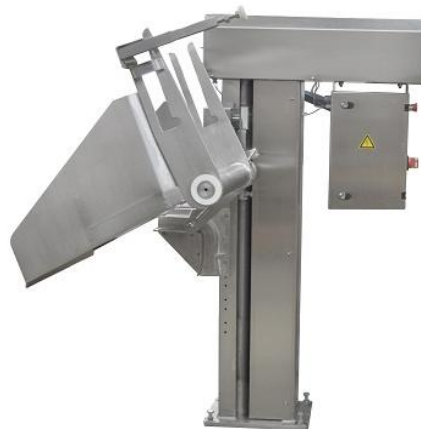
31.0307.22 – maksimalus iškrovimo aukštis 700 mm