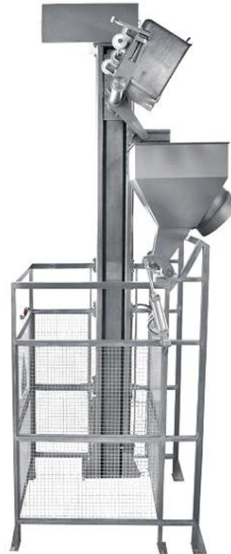
31.1540.22 – 300 l, 500 kg, su kilnojama dėkle ir apsauginiu atitvaru