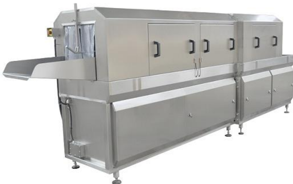
20.0202.00 – для 240 ящиков – с металлическими боковыми крышками – переключателями