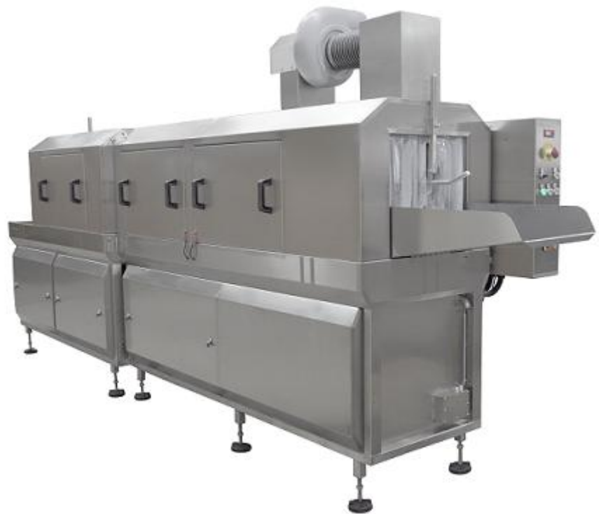
20.0222.00 – для 240 ящиков – с вентиляцией – металлическими боковыми крышками – защитными переключателями