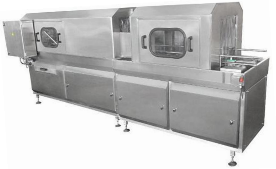
20.0213.00 – для 240 ящиков