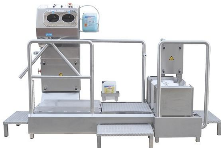
10.4031.00 – su aulinių batų valymo modulių