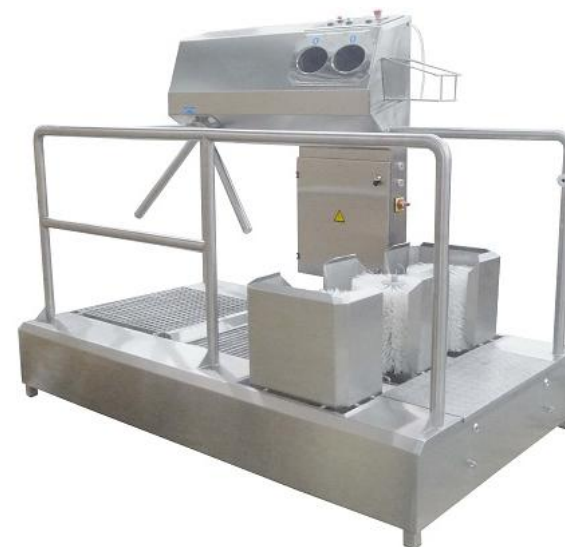
10.4221.55 – su aulinių batų valymo modulių, vonia