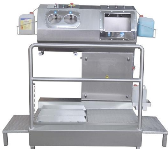
10.4013.55 – be besisukančio sukučio