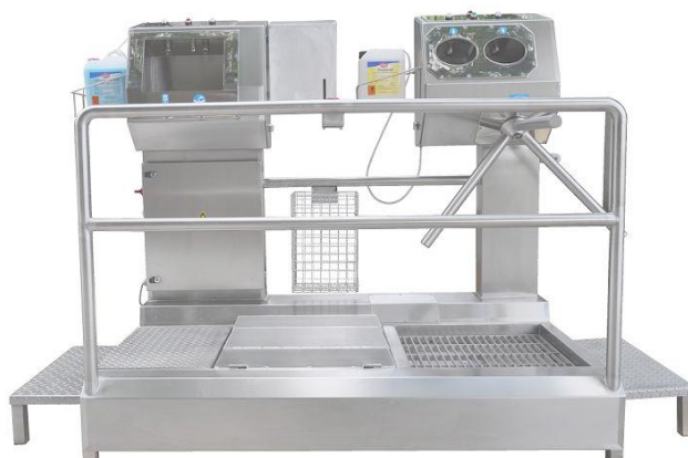
10.4212.00 – Dozatorius rankšluosčiams ir šiuokšlių dėžė