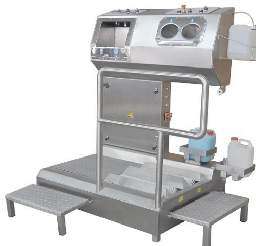
10.4012.51 be besisukančio sukučio, su laipteliu prie kriauklės