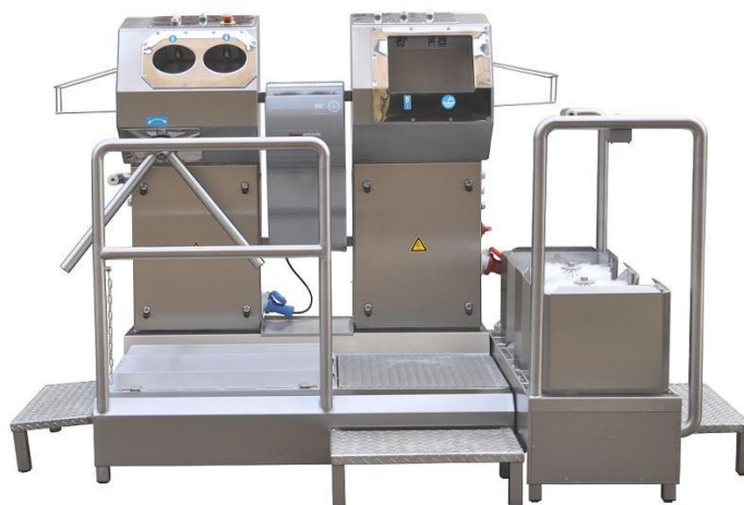
10.4033.03 – su kriaukle, rankų džiovykle, autonominiu modulių aulinių batų valymui