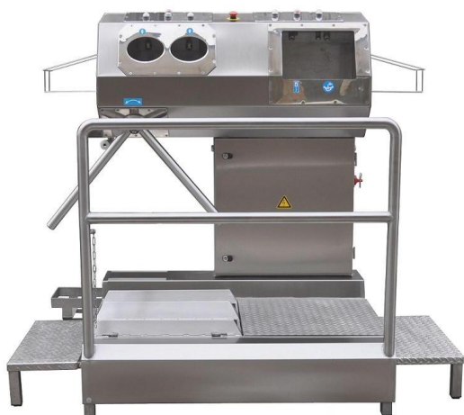
10.4013.50 – šepėčiai 500 mm