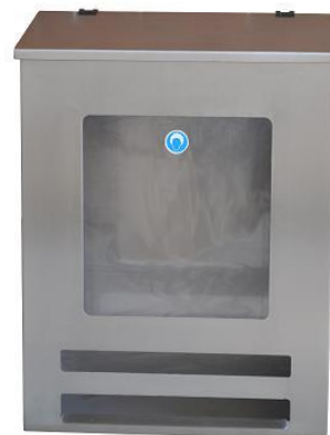
62.4043.00 – Plaukų tinklelių skirstytuvas.