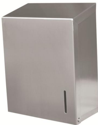
62.4042.00 – Rankšluosčių skirstytuvas