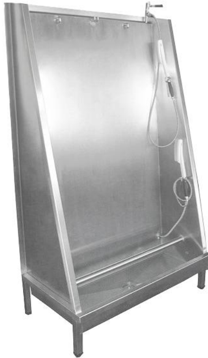
12.8310.00 – Prijuosčių ir aulinių plovykla